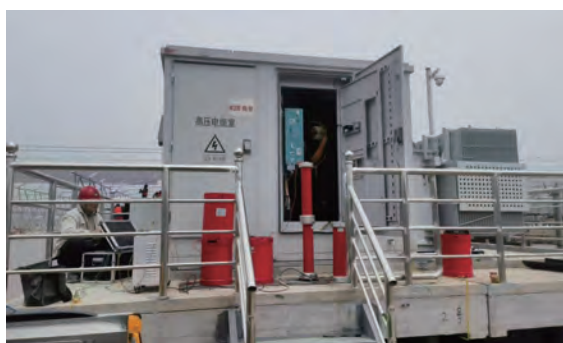
五一期间，供电工程分公司全力投入三峡河口盐场“光伏复合”项目变压器试验工作，经过连续奋战，圆满完成全部检测任务，为项目顺利推进提供重要保障。（史春飞）

落实监管保障，消除安全隐患。深入剖析安全生产中存在的操作规范执行不严格等突出问题与薄弱环节，制定针对性的治本攻坚措施。加强对重点领域的安全管控，细化流程，严格监督。重视对事故隐患和潜在风险的评估预判。对管理体系进行查漏补缺，突出实际应用的可行性、针对性、精准性、及时性，力求科学高效，保障设备可靠运行。（李竹荻）