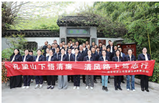
为进一步加强廉洁文化建设,提升党员干部廉洁自律意识,增强党性修养,筑牢拒腐防变的思想底线。4月17日,台北投资公司党委组织党员干部赴孔望山廉洁文化教育基地开展“孔望山下悟清廉 清风路上笃志行”实境教育活动。(北 纪)

筑牢主基调,构建廉政载体。秉持“严是爱,松是害,不闻不问要变坏”的理念,持续强化纪律监督。对小事多提醒、多管理,对大事严查严办,督促干部少犯乃至不犯错误。弘扬正气、树立清风,坚持“咬耳扯袖”式警示教育,严防“小毛病”滋生。落实“三个区分开来”,以“阳光”般厚爱党员干部,激发其内生动力,为敢于担当、踏实做事、冲锋在前的干部撑腰鼓劲,及时修补干部思想堤坝的漏洞。坚持有教无类,寓教于行,提升干部的反腐警觉性、思想觉悟性和行为自律性,守护廉洁清正的政治生态。采用“多触摸+”及“四不放过、两个跟进”的工作模式,运用“互联网+监督”“视频+”“现场+”“青年+”等多元工作形式,开创党风廉政建设和反腐败工作新局面,护航企业高质量发展。(赵 媛)