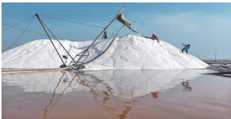
连日来，在工业投资集团日晒制盐公司1.5万亩盐田上，工人们抢抓晴好天气，加紧进行春季扒盐作业。央视新闻进行了专题播报。