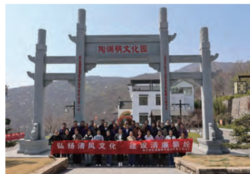
清明期间，氨纶公司纪委组织30余名党员干部赴连云港陶渊明文化园开展“弘扬清风文化 建设清廉氨纶”廉政实景教育，通过“沉浸式课堂”“互动研学”等形式，为企业发展涵养清正生态。（刁嘉程）