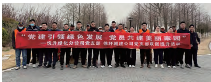
近日，徐圩悦升绿化分公司党支部与徐圩城建党支部50余名党员、志愿者联合开展“党建引领绿色发展，党员共建美丽家园”主题党日。现场分组协作完成培土、浇水等工序，为树木筑牢根基，以劳动汗水诠释“绿水青山就是金山银山”理念。双方还就深化党建联建、推动生态建设达成合作意向，以实际行动为徐圩新区增绿添彩。（潘浩）

抓学习，强素质。建立健全“培训、练兵、比武、晋级、激励”一体化技能竞赛机制，开展年度劳动竞赛、消防大比武、“安康