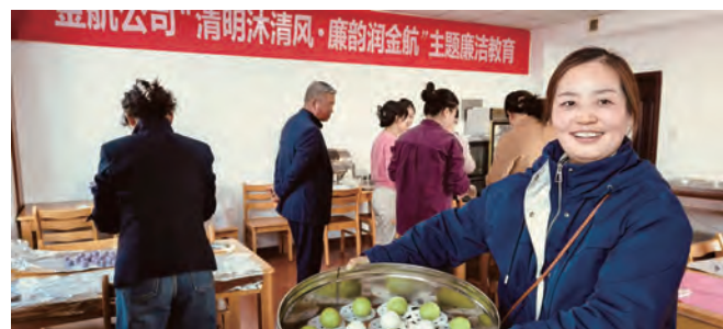
清明节前，金航公司精心组织开展“清明沐清风·廉韵润金航”主题教育活动，通过发放廉洁倡议书、观看警示教育片、包青团等形式，将传统节日与廉政教育深度融合，营造风清气正的企业文化氛围。（许薇）

优化“党建+人才培养”。构建人才培养体系。实施“双导师”制度，由业务骨干与党务干部联合施教，将红色基因融入专业培养。建立AB角轮岗矩阵，鼓励跨岗位学习。推进“名师带高徒”，提升人才的实战能力，打造多层次、多渠道的人才培养体系。建立后备人才梯队。推行“金种子”计划，360度评选后备干部，实施阶梯式压担培养，解决“青黄不接”的问题，形成“储备—培养—任用”动态循环。实施“三鹰”人才计划，优选青年干部参与集团“双锐”“调培生”等人才培养计划。依托大数据分析绘制能力图谱，实行个性化培养，精准赋能，形成“近期可用、中期培养、长期储备”的人才库。深化人才激励机制。实施竞争上岗、畅通员工晋升通道。修订销售人员分配方案，实现能者多得，修订科技人员激励办法，推行技术研发人员分享新产品销售提成，探索实施高技能人才协议工资制和项目工资制等多种分配形式，调动科技人员的工作积极性。（韩奇）